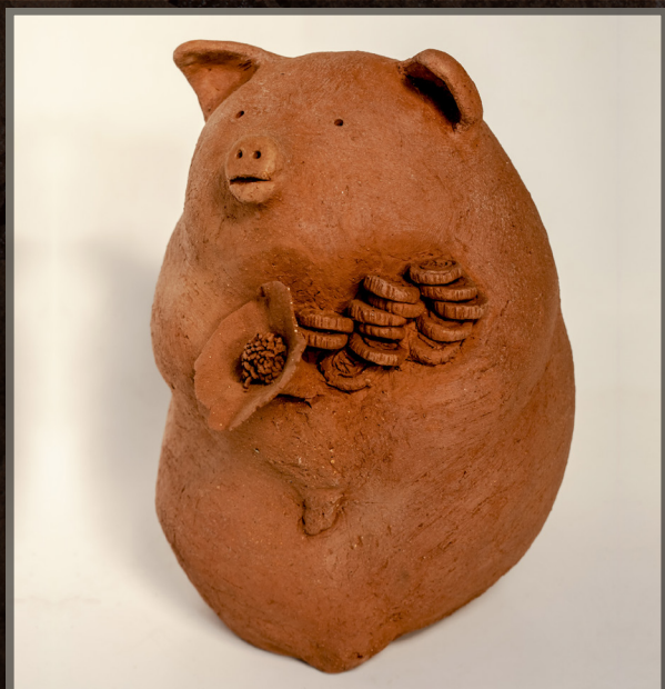
CHANCHITO DE LA FORTUNA