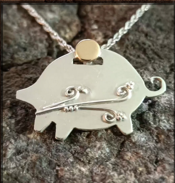
CHANCHITO DE POMAIRE