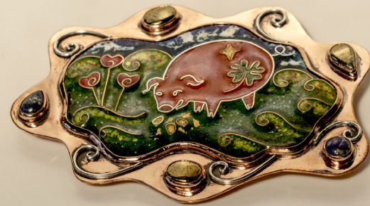
BROCHE DE LA SUERTE