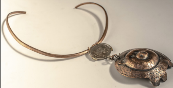
PESO A PESO