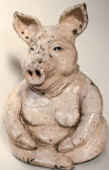
EL CHANCHITO DE LA SUERTE